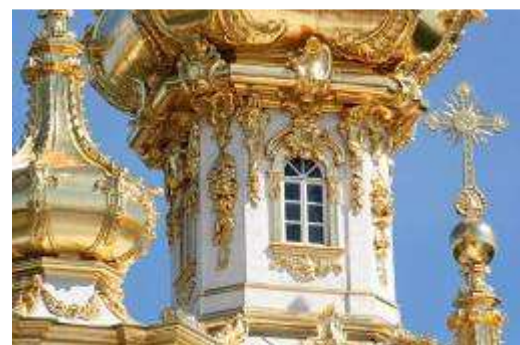
Détail Peterhoff – Saint Petersburg